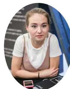
Проектная работа по репортажной съемке с фотографом-документалистом ПОЛИНОЙ СОБОЛЕВОЙ .